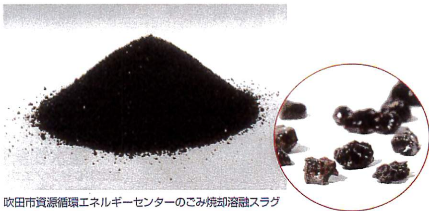
吹田市資源循環エネルギーセンターのごみ焼却溶融スラグ